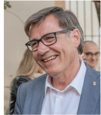
Xavier Fonollosa i Comas Alcalde de Martorell