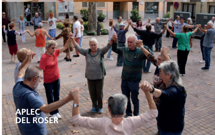
APLEC DEL ROSER