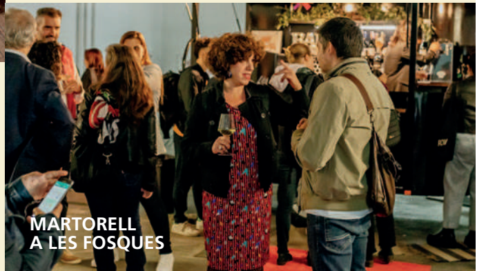
MARTORELL A LES FOSQUES