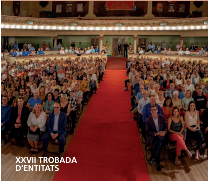
XXVII TROBADA D'ENTITATS