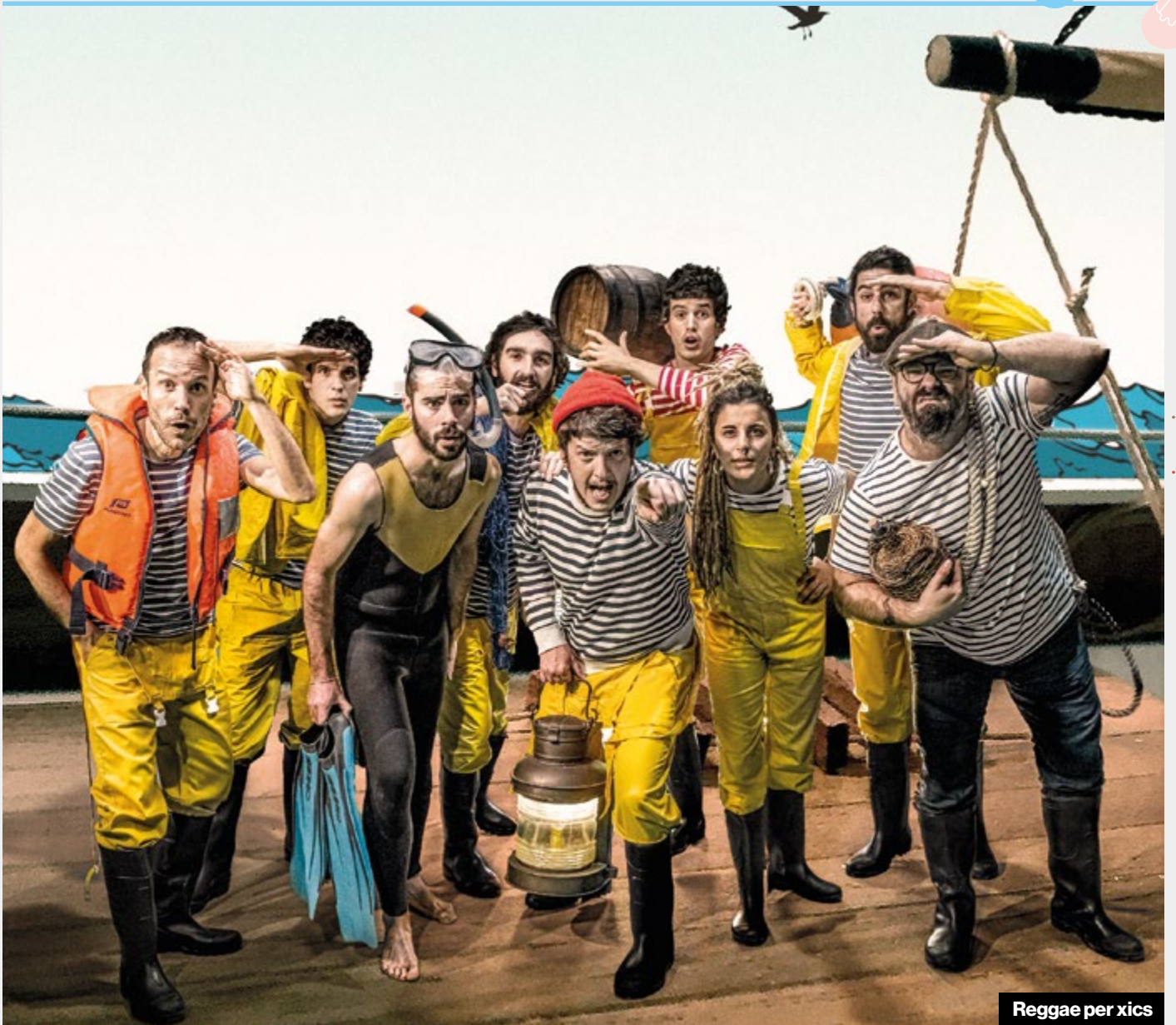
Reggae per xics