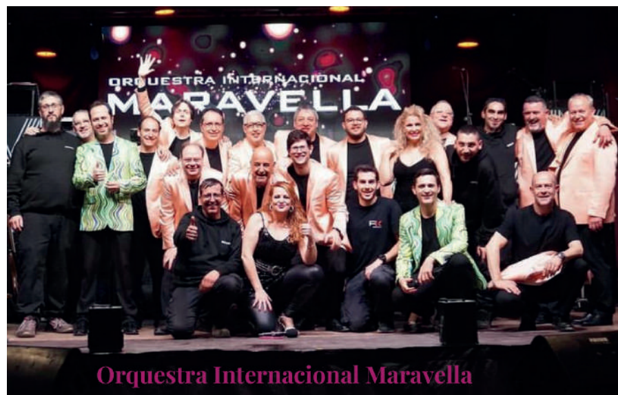
Orquestra Internacional Maravella

Org: Centre Cultural i Recreatiu El Progrés