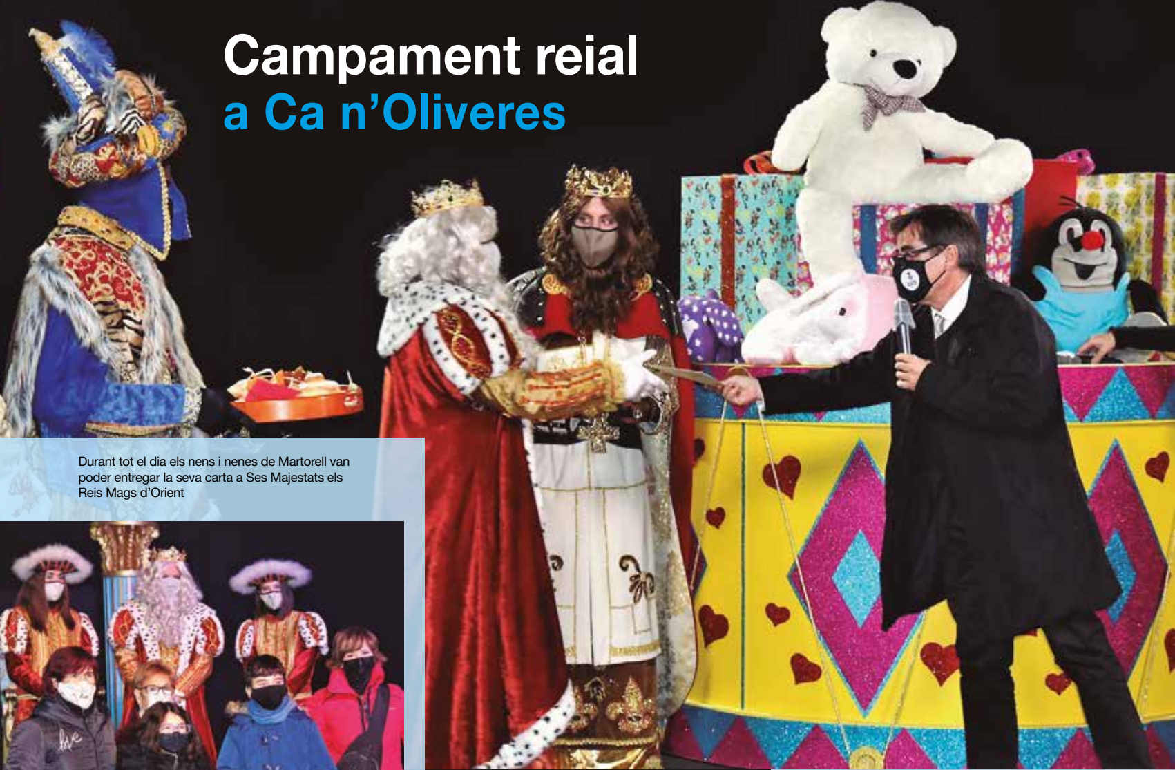
Durant tot el dia els nens i nenes de Martorell van poder entregar la seva carta a Ses Majestats els Reis Mags d'Orient