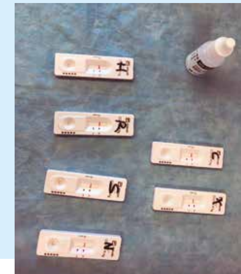
LA BIBLIOTECA MUNICIPAL DE MARTORELL VA SER L'ESPAI CEDIT PER L'AJUNTAMENT PER FER ELS CRIBATGES CONTRA LA COVID.