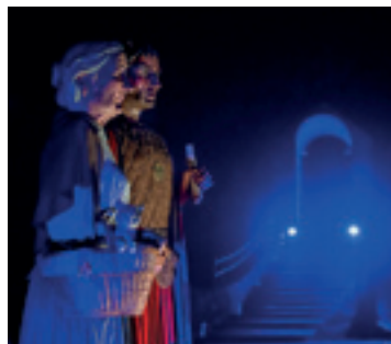
CULTURA I OCI