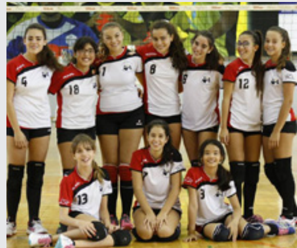
MÉS DE 80 ESPORTISTES I NOU ENTRENADORS FORMEN EL CLUB