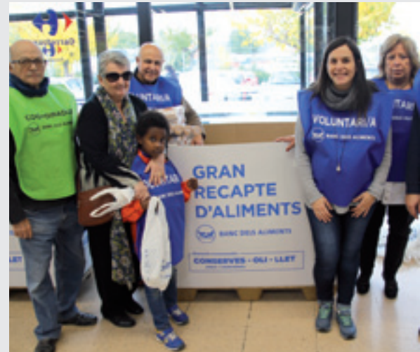
MÉS DE 50 VOLUNTARIS HO VAN FER POSSIBLE

Els clients de set supermercats ubicats a Martorell van dipositar 20.700 quilos de menjar bàsic per a persones necessitades en la 8a edició del Gran Recapte dels Aliments, celebrat els passats dies 25 i 26 de novembre. La xifra supera en 1.330 quilos la que es va assolir l'any passat, i va satisfer el Banc dels Aliments, l'entitat organitzadora. Una cinquantena de voluntaris va fer torns a les entrades dels establiments per informar, acompanyar i orientar els clients en aquesta iniciativa solidària. La campanya es va desplegar des de primera hora del divendres 25 i fins al tancament vesperí del dissabte 26. Els clients que van anar a comprar durant aquesta franja horària a set supermercats de Martorell van poder dipositar una part de les seves adquisicions alimentàries (productes bàsics, no peribles o de llarga caducitat) en les grans caixes habilitades per a l'ocasió.