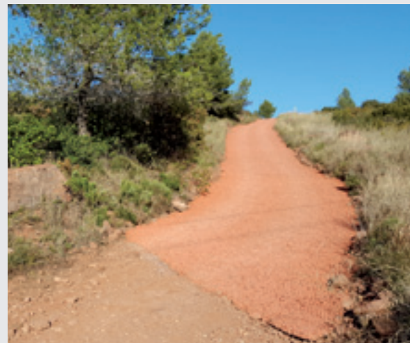
LA IMPORTÀNCIA DE LA PREVENCIÓ: "ELS INCENDIS S'APAGUEN ARA"