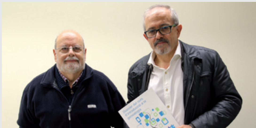
LA INFORMACIÓ ORAL I DESPRÉS LA DOCUMENTAL SÓN LA BASE DELS ARBRES GENEALÒGICS