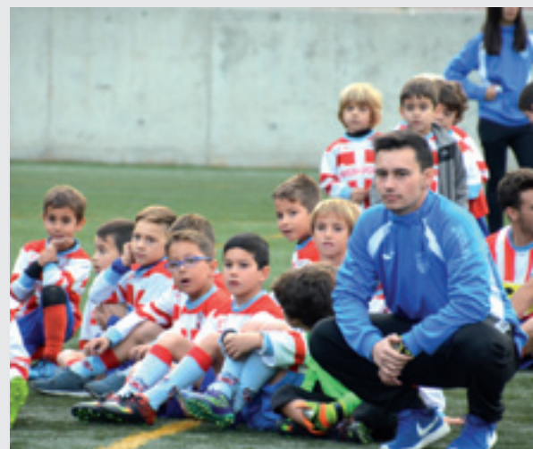
MÉS DE 550 FUTBOLISTES DE TOTES LES EDATS FORMEN EL CLUB