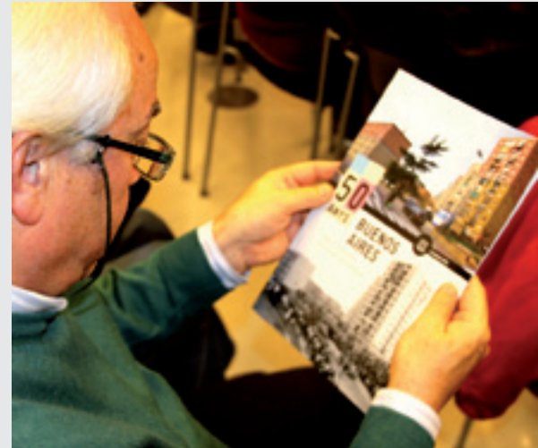
EL LLIBRET ESTÀ DISPONIBLE AL CENTRE CULTURAL