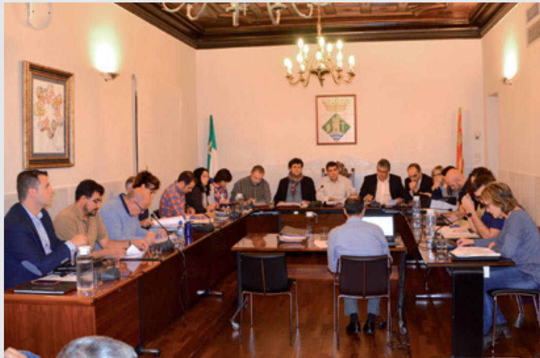
EL PAGAMENT DOMICILIAT DE L'IBI ES PODRÀ FRACCIONAR EN QUATRE TERMINIS.

Casasayas anuncia també que l'Ajuntament té previst incloure en el pressupost de 2017 un seguit de subvencions per a l'IBI.