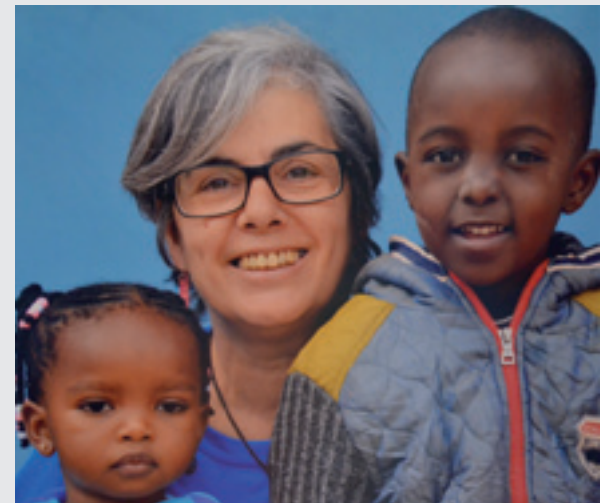
ANY RERE ANY, MANS MERCEDÀRIES EXPORTA SOLIDARITAT.