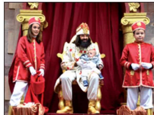
PATGE VIU VIU