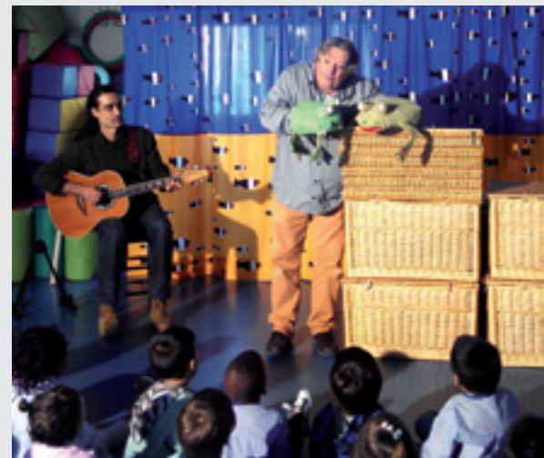
ESPECTACLE GRANOTES I GRIPAUS, DE CESC SERRAT.

Acostar els infants al món del teatre, integrar aquesta activitat dins del currículum escolar i reforçar el lèxic dels alumnes. Aquests són alguns dels objectius dels Cicles de Teatre Escolar que s'organitzen a Martorell des del curs 1989-90 per als diversos cicles dels centres d'infantil i primària i que han programat prop de 1.000 sessions amb la participació d'uns 8.000 alumnes. "S'han representat espectacles de teatre dramatitzat, titelles, clown, musicals i ombres xineses i, des del 2013, els Cicles de Teatre Escolar incorporen també una sessió en anglès per fomentar-ne l'aprenentatge", explica un dels responsables, el professor Jordi Morera. Les obres es representen a l'auditori Joan Cererols del Centre Cultural. El cicle de la tardor ha finalitzat aquest novembre.