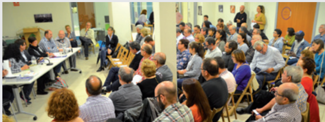
EL CARRER ANSELM CLAVÉ SERÀ EL 18 DE DESEMBRE EL CARRER DE LA MARATÓ.